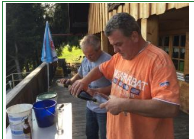
Wichtig bei der Hitze: Viel trinken !!