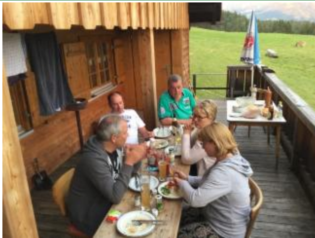
Erschöpft aber zufrieden beim Abendessen