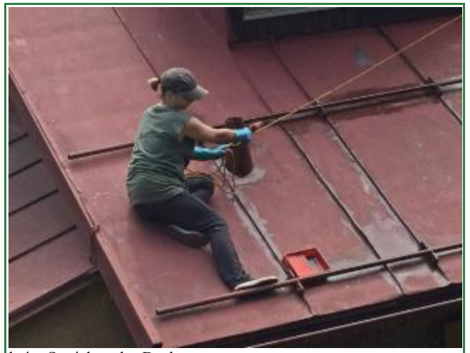
beim Streichen des Daches